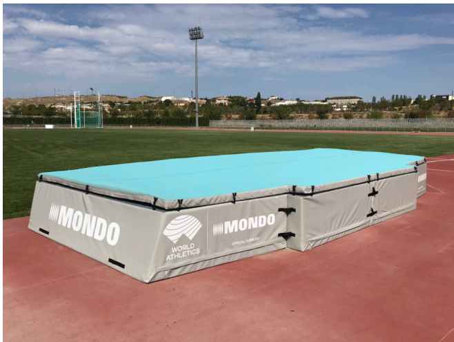
Conjunto de la zona AA139