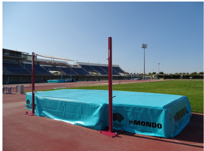
Zona AA139 con funda de protección AA191